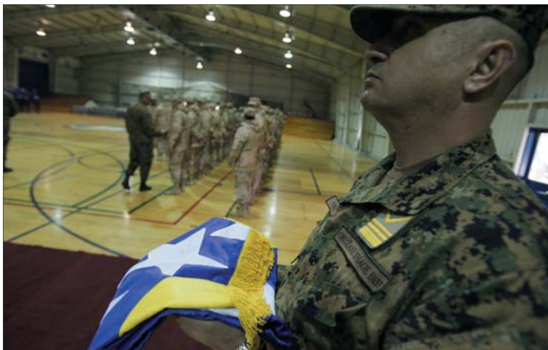
Spremni za opasnu zadaću