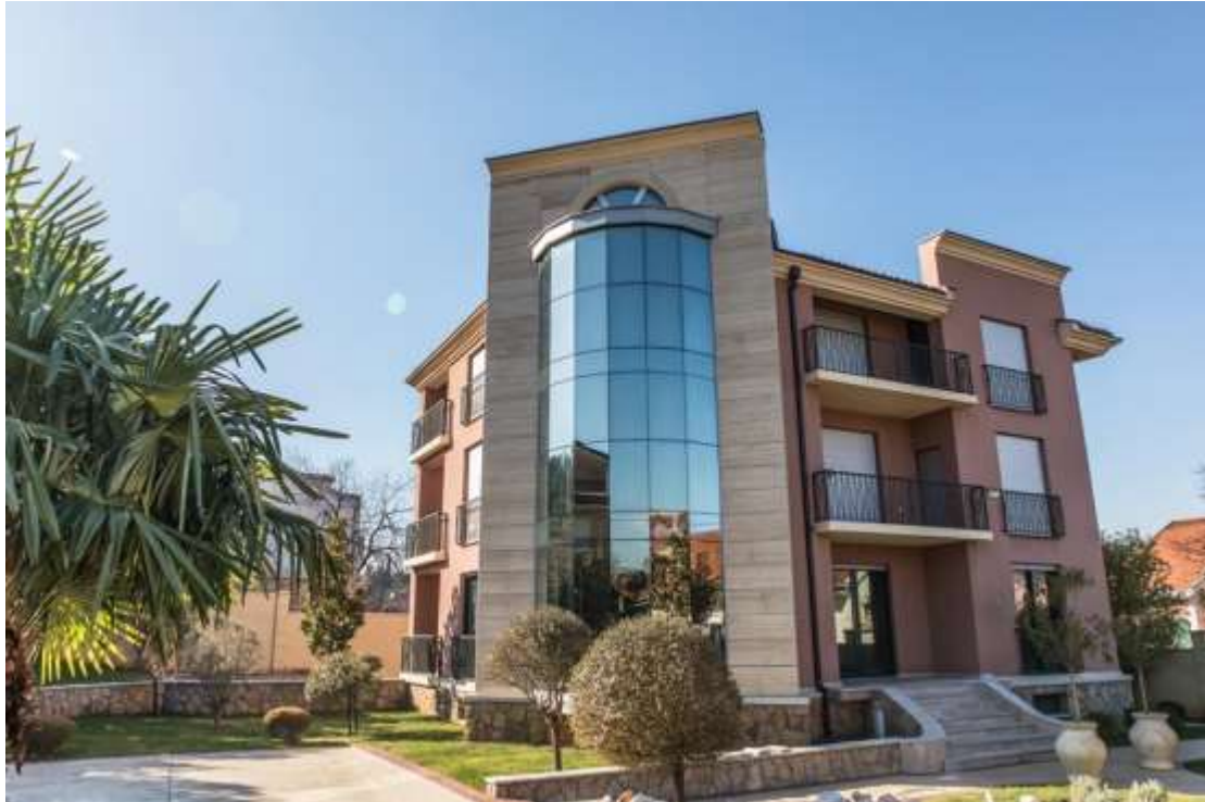
Ambasada Bosne i Hercegovine u Podgorici

S tim u vezi, krajem 2023. godine kupljen je objekat za potrebe Ambasade Bosne i Hercegovine u Podgorici a 2024. godine planirano je opremanje i useljenje u isti.