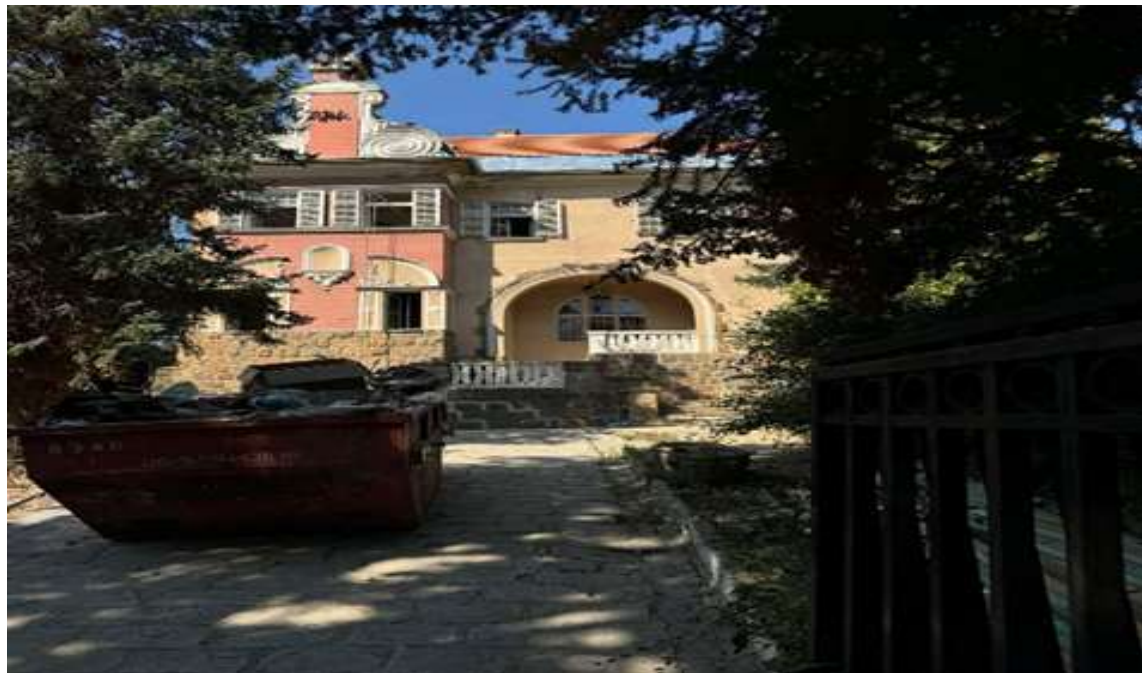
Objekat Bosne i Hercegovine u Budimpešti

U planu je nastavak na rekonstrukciji objekta Bosne i Hercegovine u Budimpešti i Teheranu s ciljem useljnja u iste i smanjenje troškova za zakupe prostora.