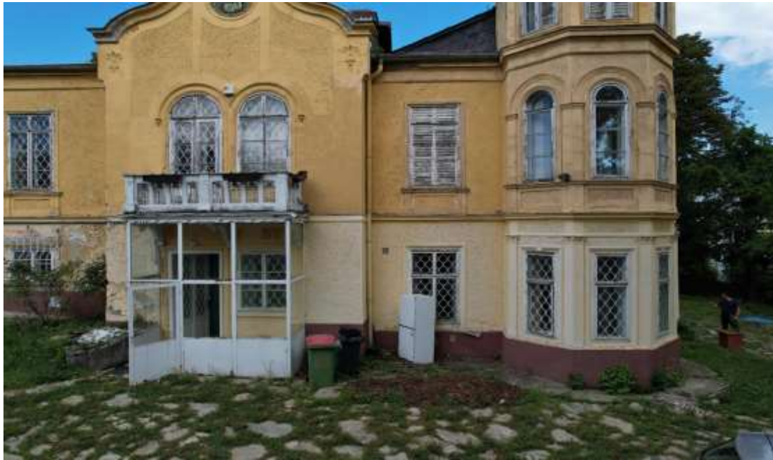
Objekat Bosne i Hercegovine u Beču

U planu je nastavak na rekonstrukciji objekta Bosne i Hercegovine u Budimpešti i Teheranu s ciljem useljnja u iste i smanjenje troškova za zakupe prostora.