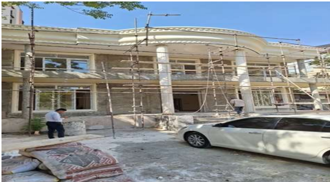
Objekat DKP BiH u Teheranu

Sve prethodno navedene aktivnosti se sprovode sa jasnim ciljem: Unapređenje političkih i ekonomskih odnosa sa zemljama partnerima i međunarodnim organizacijama te širenje i unapređenje organizacije i koordinacije rada u diplomatsko-konzularnoj mreži Bosne i Hercegovine.